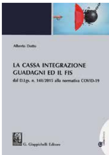
Il libro di Dotto sulla Cassa Integrazione

ti bidirezionali e questo ha consentito, di fatto, di non interrompere mai la relazione con questi importanti partner, soprattutto nella fase più difficile della pandemia.