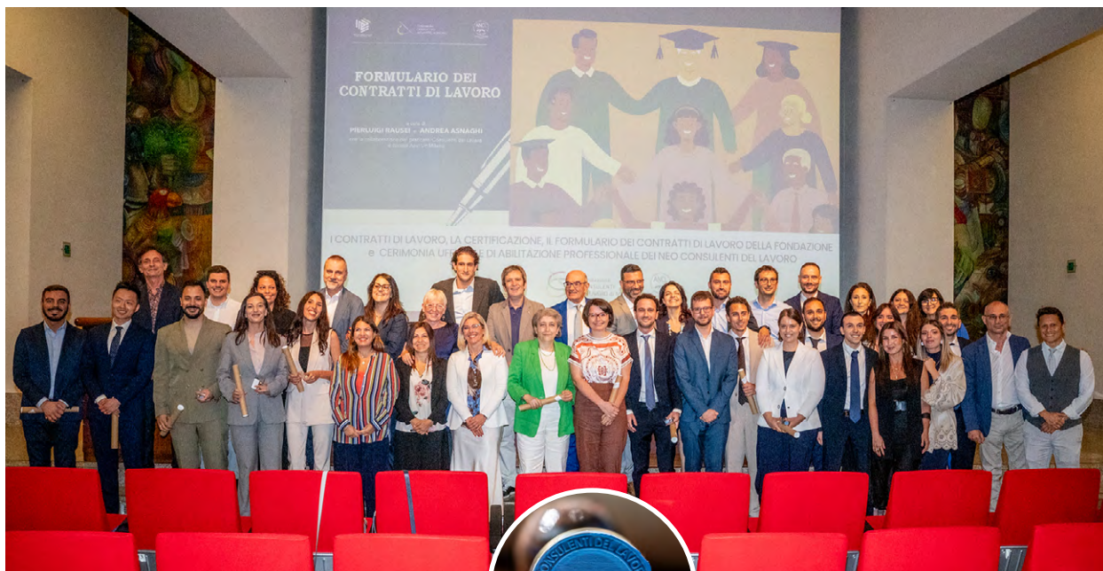
Foto di gruppo dei neo abilitati accanto ai vertici istituzionali dell'Ordine Prov. dei Consulenti del Lavoro di Milano e dell'Ancl Up Milano, dei Commissari d'esame e Rappresentanti delle istituzioni. A destra il Timbro a sigillo offerto dall'Ancl e Pergamena.