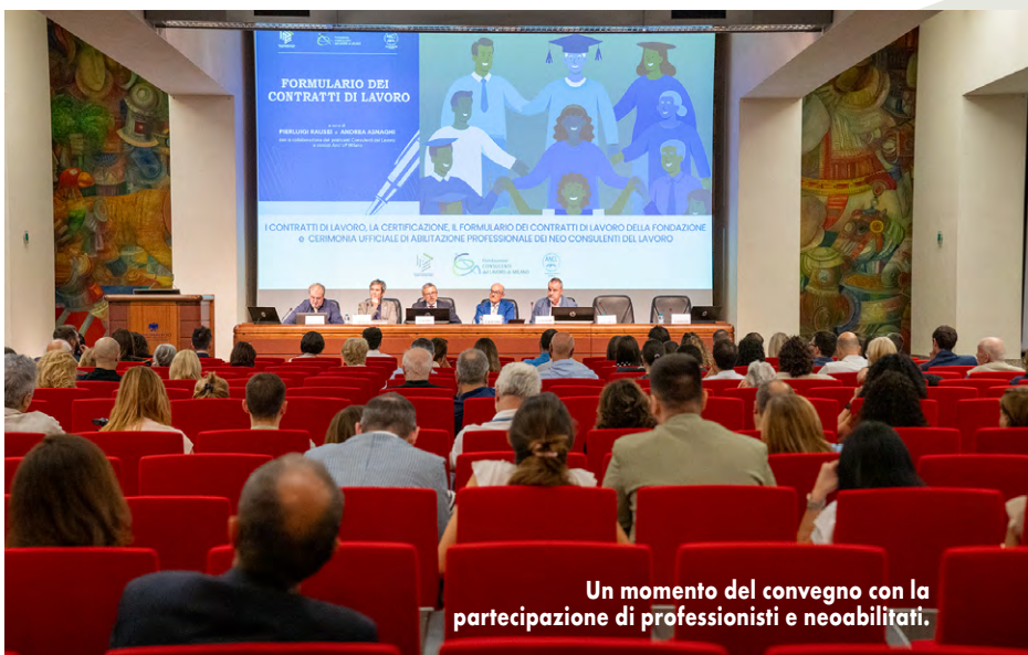
Un momento del convegno con la partecipazione di professionisti e neoabilitati.

Un pomeriggio di grande intensità ed emozioni quello vissuto nella Sala Orlando dell'Unione del Commercio di Milano lo scorso 12 giugno, dove scienza giuridica e tradizione professionale si sono incontrate in un evento che ha saputo coniugare alta formazione e solennità istituzionale.